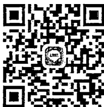
QR Code กลุ่มงานการเงิน